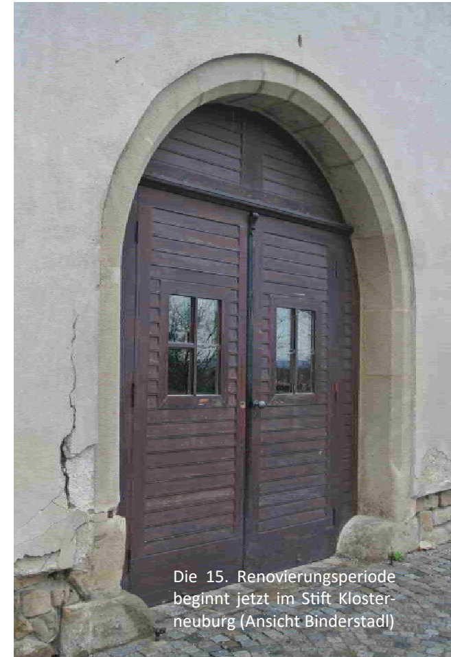
Die 15. Renovierungsperiode beginnt jetzt im Stift Klosterneuburg (Ansicht Binderstadt)

Offenlegung Medium Wienerland, Freizeitmagazin, erscheint monatlich Medieninhaber Wienerland, Zeitung & Verlag, Pamessergasse 13, A 2103 Langenzersdorf, ZVR 457838689, Redaktion Fritz Peterka office@wienerland.at , www.wienerland.at