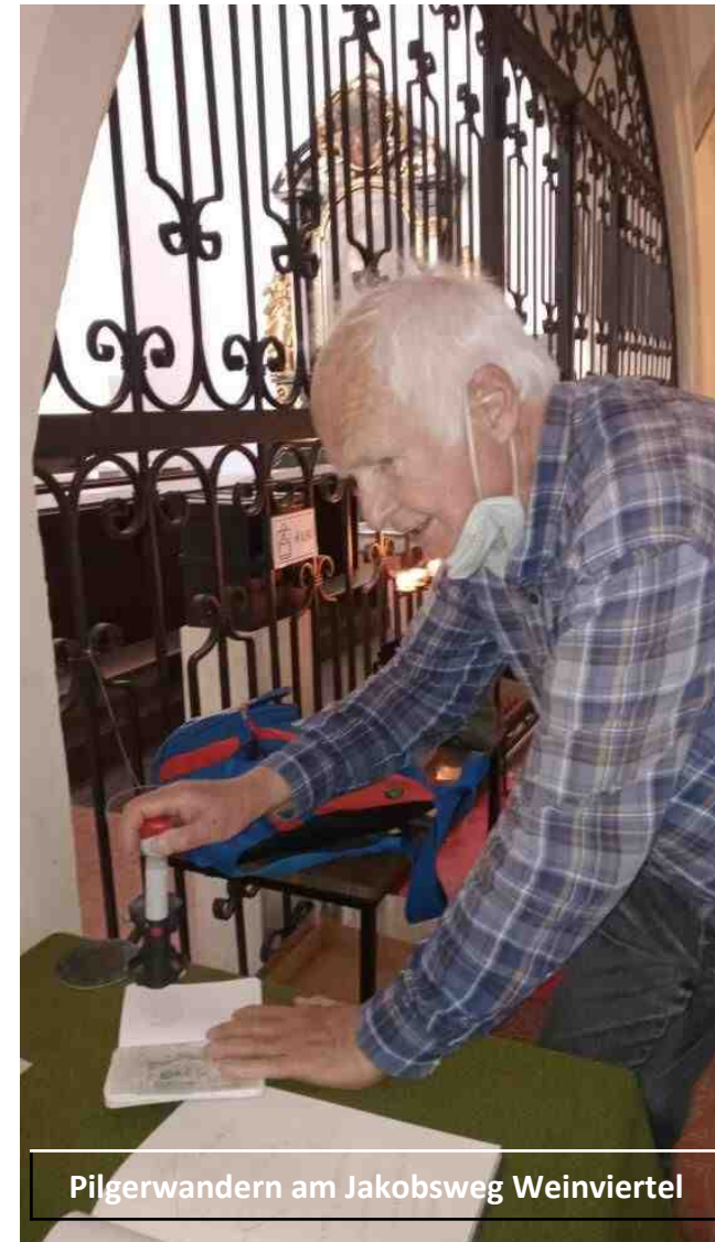
Pilgerwandern am Jakobsweg Weinviertel

Offenlegung Medium Wienerland, Freizeitmagazin, erscheint monatlich Medieninhaber Wienerland, Zeitung & Verlag, Pamessergasse 13, A 2103 Langenzersdorf, ZVR 457838689, Redaktion Fritz Peterka, Telefon 02244/3536, Fax 35364, office@wienerland.at , www.wienerland.at