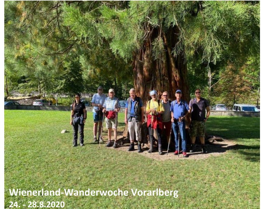
Wienerland-Wanderwoche Vorarlberg 24. - 28.8.2020

Erscheinungsort 2103 Langenzersdorf 43. Jahrgang, Heft 405, 9/2020, September 2020