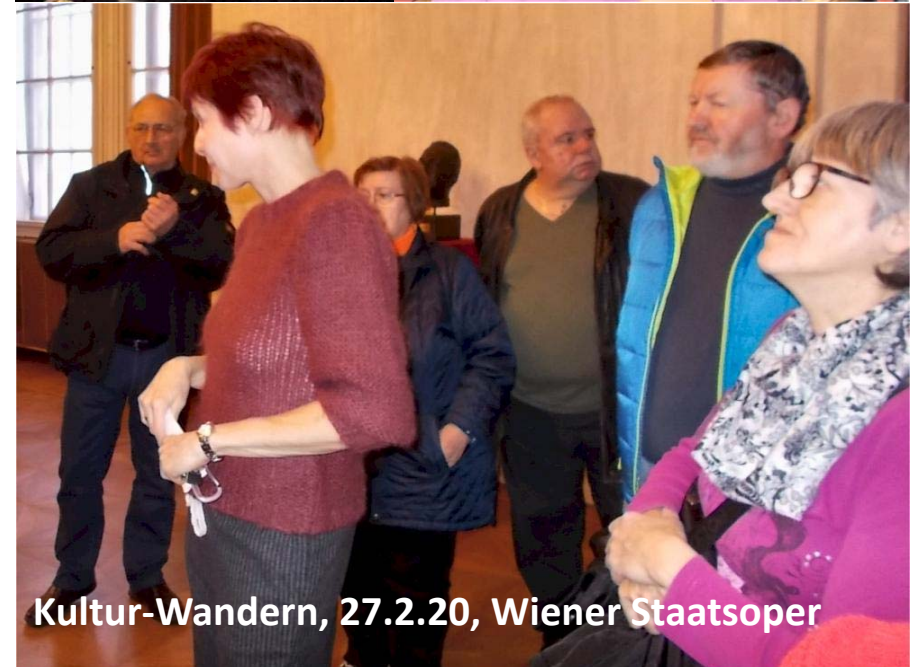
Kultur-Wandern, 27.2.20, Wiener Staatsoper