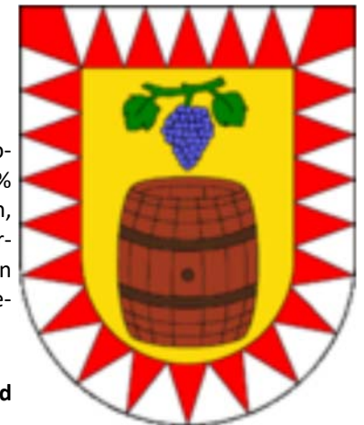
Wappen von Algund

Staat Italien, Region Trentino - Südtirol, Provinz Bozen - Südtirol, Sprachgruppen 85,17% deutsch, 14,58% italienisch, 0,25% ladnisch, Höhe 302 - 2600m, 23,6 km 2 , 150 Unterkünfte, 22 Gastronomiebetriebe, 5 Buslinien inkl. City Bus, 1 Bahnstation der Vinschgebahn